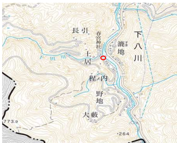
納入場所② (国道194号 新下八川橋先の倉庫)